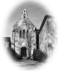
CAUSANS St Martin

Feuille n°11– Année A 4 ème dimanche de Carême 15 mars 2026