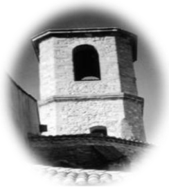
JONQUIERES St Mappalice