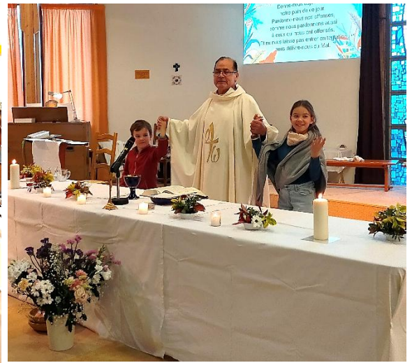
Jeudi Saint (Cène du Seigneur)