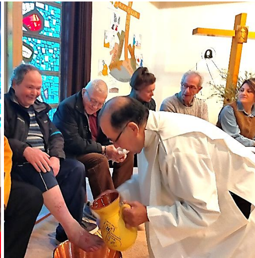
Jeudi Saint (lavement des pieds)