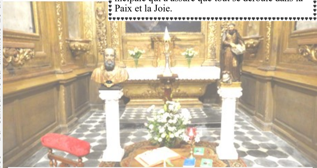
La statue de César de Bus nouvellement acquise grâce à une souscription paroissiale, remise en état par les soins de l'association Kabellion et offerte à la Cathédrale.