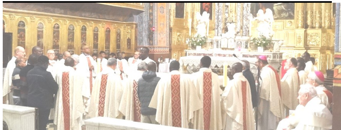
Le renouvellement des vœux des pères de la Doctrine Chrétienne.